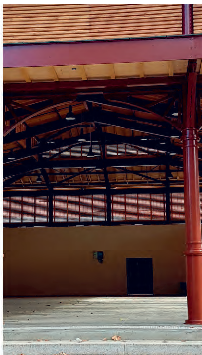
cadre de vie