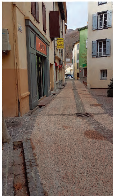
➤ Rue Marcaillou, pendant et après les travaux