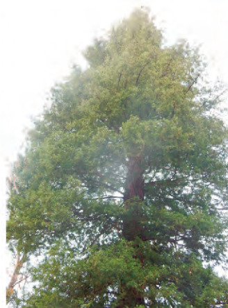
➤ Séquoia sain

Un Séquoia géant de + de 150 ans situé dans le parc du Teich était malade, cet arbre peut normalement vivre jusqu'à 2000 ans, malheureusement celui-ci est tombé malade, il est quasiment mort et devenait donc dangereux. Nous sommes dans l'obligation de le couper, à sa place, il sera replanté un nouveau Séquoia. Nous envisageons de réaliser une sculpture sur l'ancien tronc, si son état le permet.