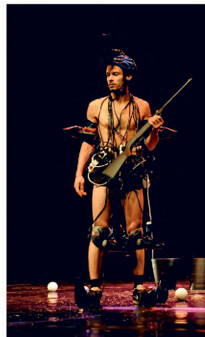
à voir, à vivre