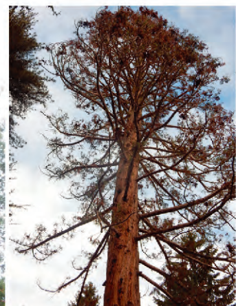
➤ Séquoia malade