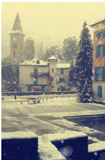
vie en ville