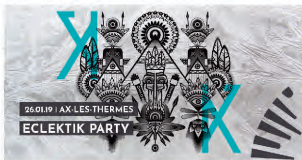
> Eclectik party