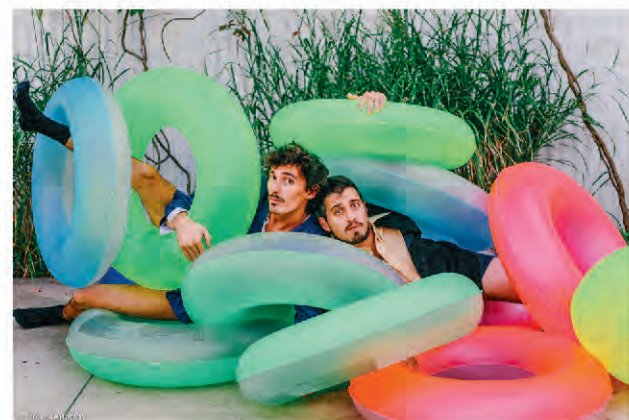
> Eclectik party

Spectacle jeune public conseillé à partir de 7 ans