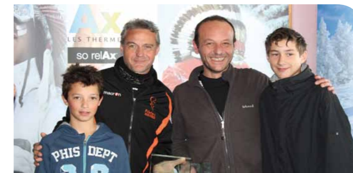
► L'équipe de la Dépêche du Midi récompensée