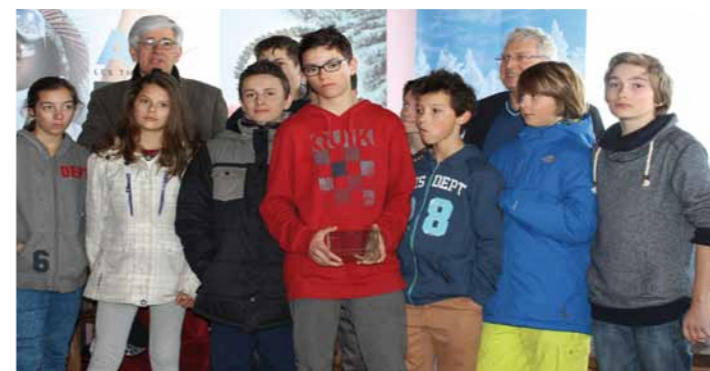
► La section sportive lors de la remise des prix

collégiens de la section sportive du Collège Mario Beulaygue qui ont notamment coaché les journalistes, très impressionnés, lors de l'épreuve de slalom spécialement planté à cette occasion par l'ESF et le Ski Club le premier jour. De l'avis de tous, la Challenge des Journalistes 2015 était une belle réussite : les médias présents ont découvert la station, mais aussi toutes les possibilités qu'offraient Ax-les-Thermes après la journée de ski. Les activités conviviales, sportives et ludiques ont permis de tisser des liens... et de donner peut-être l'envie de revenir pour un reportage sur Ax 3 Domaines ! ●