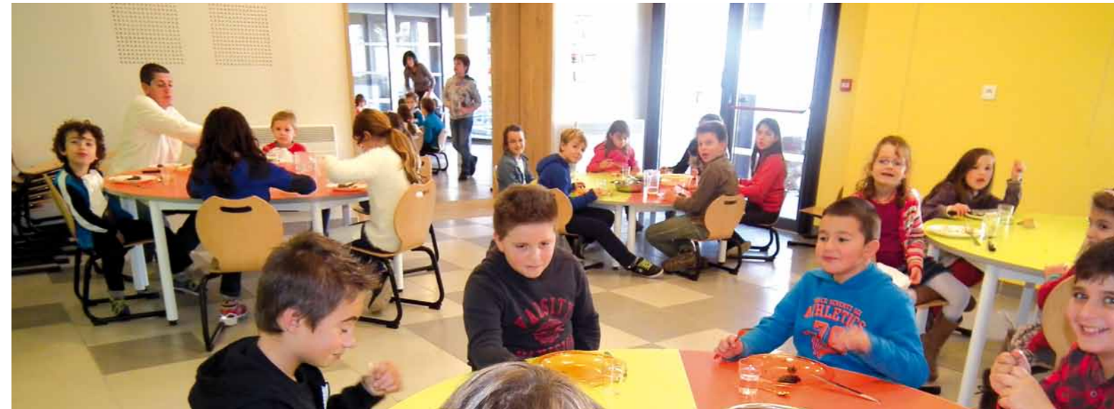
Salle de restauration de l'accueil de loisirs de Luzenac

La nouvelle directrice a d'ores et déjà de nombreux projets à mener, avec notamment le maintien du classement de l'office, le développement de nouveaux produits ou un nouveau site internet prévu cette année