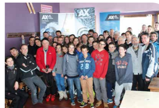
► Les équipes au grand complet