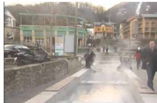
Un extrait du journal télévisé de TF1