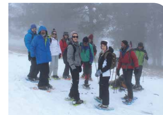
► Rando en raquettes avec le Bureau des Guides